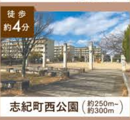
志紀町西公園 (約250m-約300m)

大阪市内へも楽々アクセス!通勤・通学に便利! JR関西本線「志紀」駅徒歩約4~5分