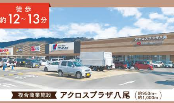
複合商業施設 アクロスプラザ八尾 (約950m-約1,000m)