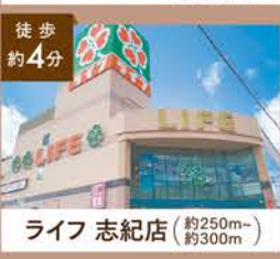
ライフ 志紀店 (約250m-約300m)