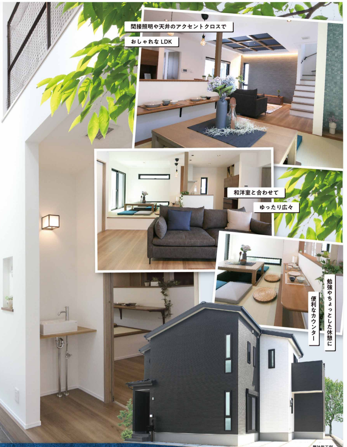
間接照明や天井のアクセントクロスで