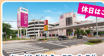
ショッピングセンター エコール・ロゼ